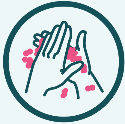
លាងដៃរបស់អ្នក