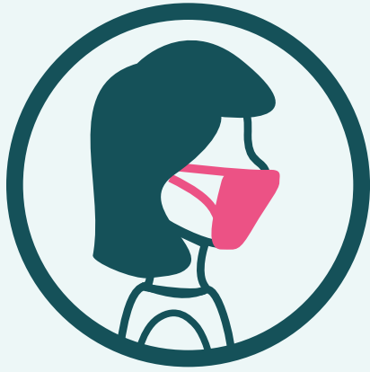
ពាក់ម៉ាស់