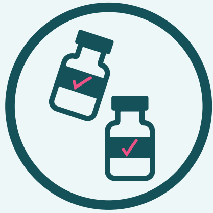
ទៅចាក់វ៉ាក់សាំង