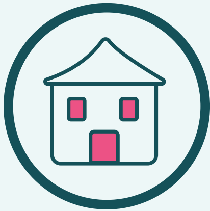
ស្នាក់នៅផ្ទះ